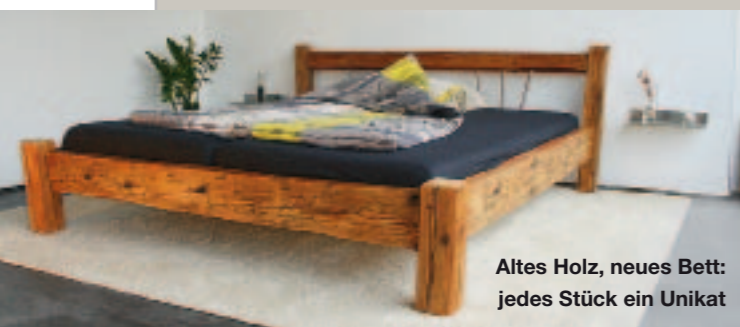
Altes Holz, neues Bett: jedes Stück ein Unikat

Waschtisch-Unterschranke fürs Bad sind zur Zeit besonders gefragt – an die 20 Modelle hat Weißer bereits entworfen und angefertigt