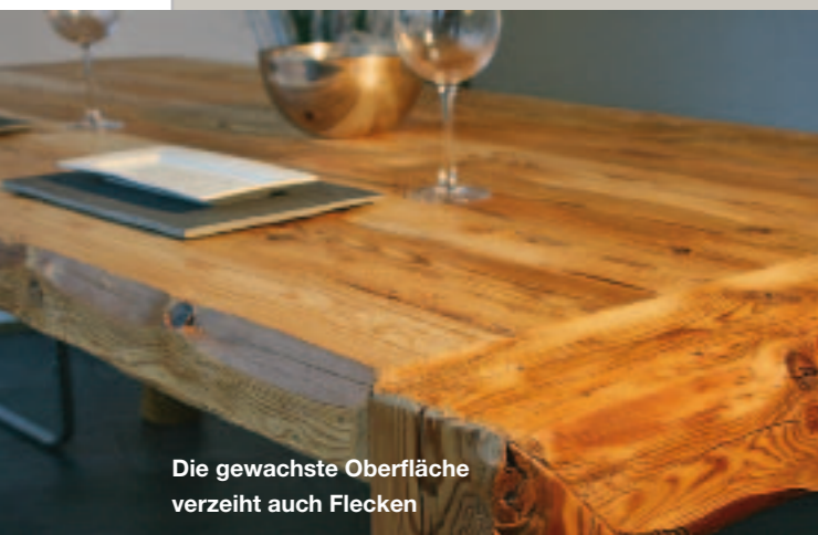
Die gewachste Oberfläche verzeiht auch Flecken